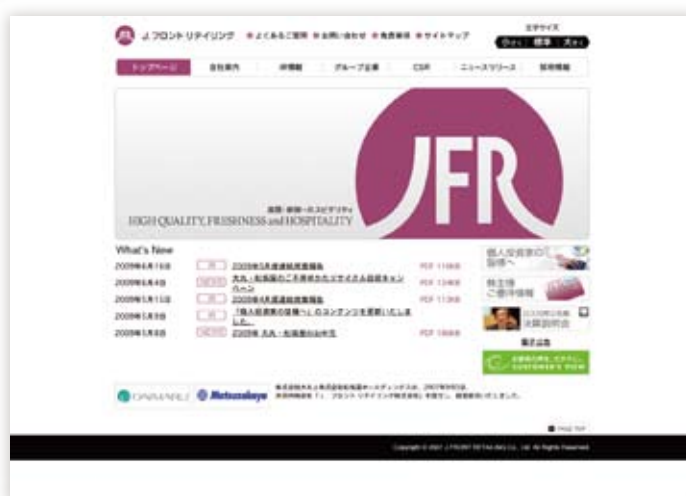
ホームページトップ画面