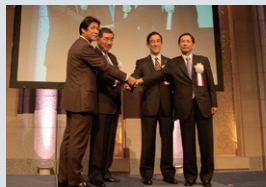
2007年9月 J.フロントリテイリング(株)を設立