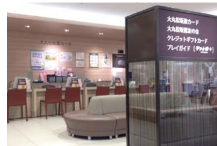
大丸東京店「カスタマーカウンター」

このように各種クレジットカードの発行を通じて、顧客固定化を推進することにより、百貨店事業の売上向上をはかるとともに、そのカードが生活の幅広い場面でお使いいただける利便性を提供することにより、クレジット事業の発展にも寄与していきます。