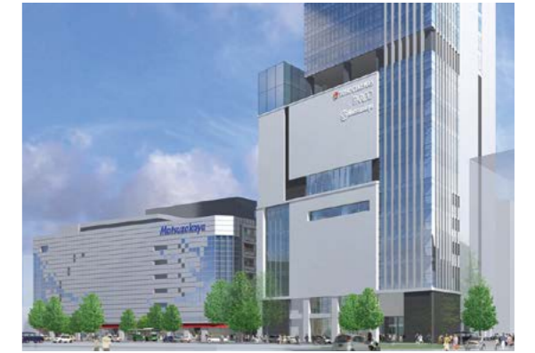
松坂屋上野店南館完成予想図(2017年秋 新南館オープン予定)