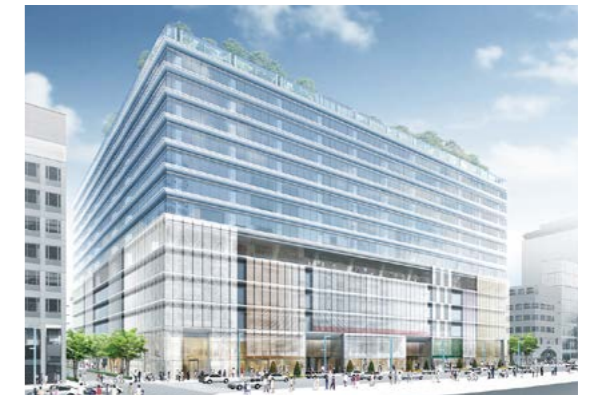
銀座地区再開発イメージ(商業施設は2017年4月オープン予定)