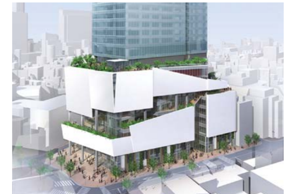
渋谷PARCOを含む宇田川町15地区開発イメージ(2019年秋 建替えオープン予定)