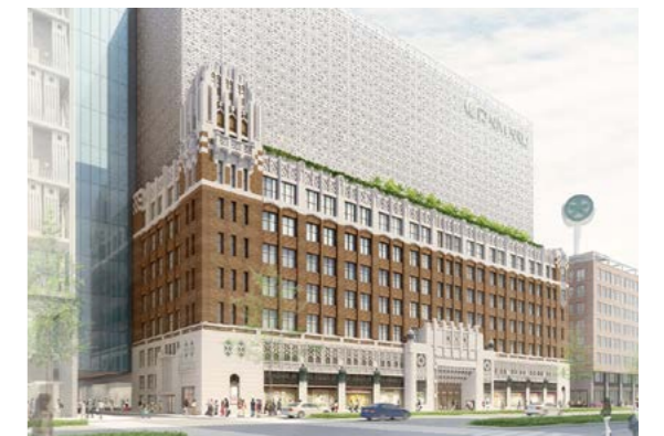
大丸大阪・心齋橋店本館完成予想図(2019年秋 本館建替えオープン予定)