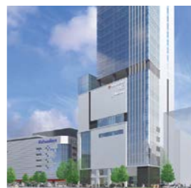
松坂屋上野店 新南館 完成予想図