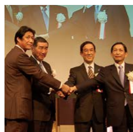
2007年9月 J.フロントリテイリング(株)を設立