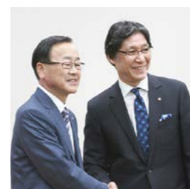
2015年5月 (株)千趣会を持分法適用関連会社化