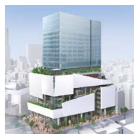
渋谷パルコ 完成予定図