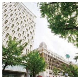
2009年11月 大丸心斎橋店北館オープン