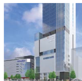
松坂屋上野店 新南館 完成予定図