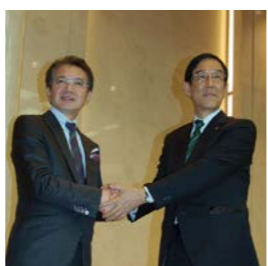
2012年8月 (株)パルコを連結子会社化