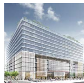
銀座六丁目10地区再開発 完成予定図