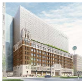
大丸心斎橋店 新本館 完成予想図