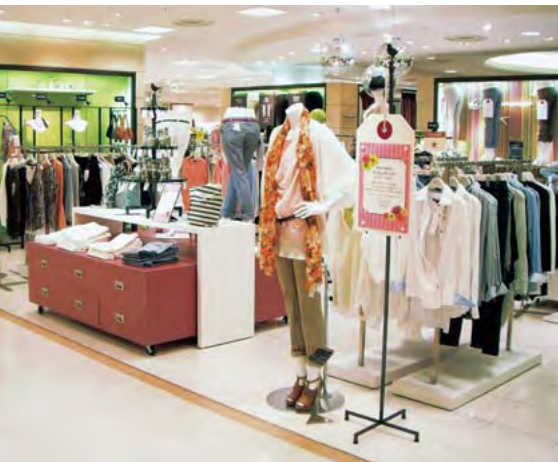
シーズンメッセージ(大丸神戸店 4階)

百貨店の売上の15~20%を占める自主運営売場の役割は、日々刻々と変化するマーケットのニーズに対応して、スピーディーに品揃えや陳列を変えたり、ショップ運営売場で品揃えされていないMDを提供したりすることによって、差別化・特徴化を進めていくことです。