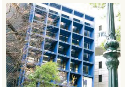
ジーニアスギャラリー