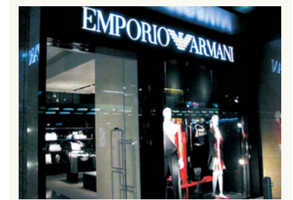
エンポリオ アルマーニ