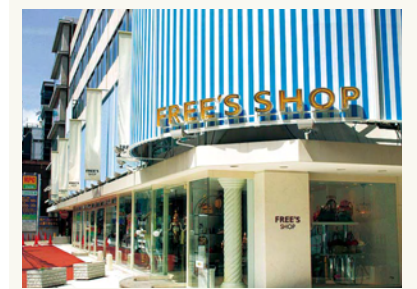
フリーズショップ