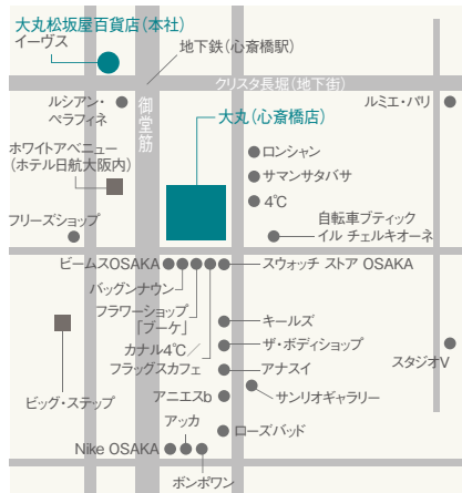
大丸心齋橋店周辺店舗