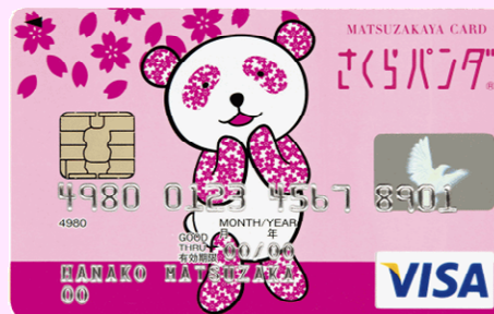
さくらパンダカード