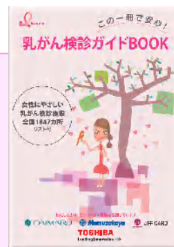
乳がん検診ガイドBOOK

[協力:株式会社東芝様、月刊「からだにいいこと」(祥伝社)様、一般社団法人まちかど健康づくりネットワーク様]