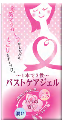
バストケアジェル